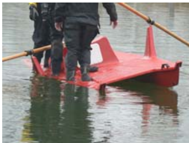
2. Teljes terhelés egy oldalra (3 fő, közeli)