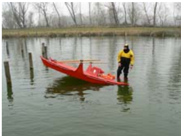
3. Terhelés egy test végén (1 fő)