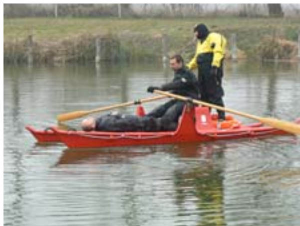
4. 1 bajbajutott 2 mentő