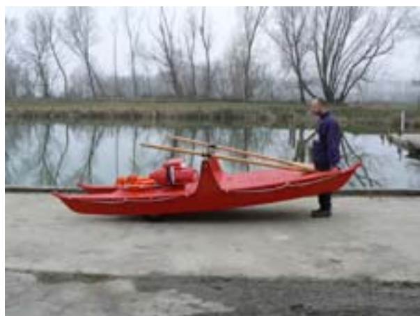
12. Mozgatás parton