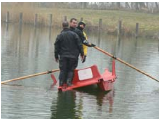
1. Teljes terhelés egy oldalra (3 fő)